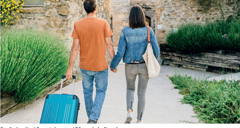
Sueño bonito / Sweet dreams / Rêvez de belles choses