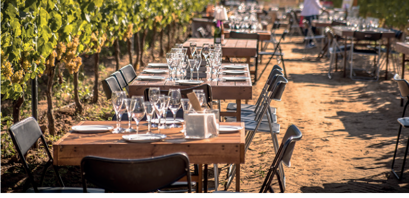
Hazo singular / Make it unique / Rendez-le unique