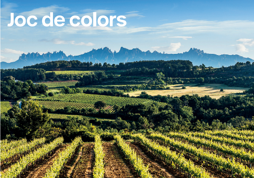
Juego de colores / Playing with colour / Jeu de couleurs