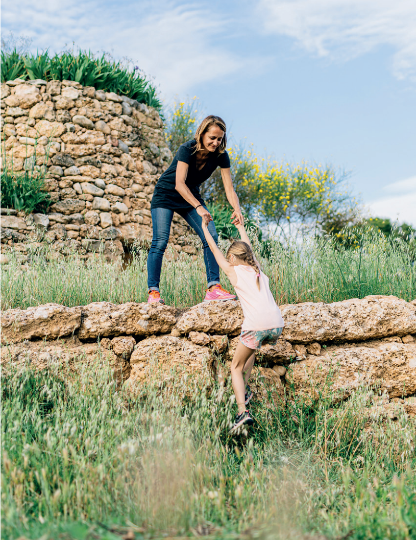
La herencia del pays / The heritage of the farmer / L'héritage du pays